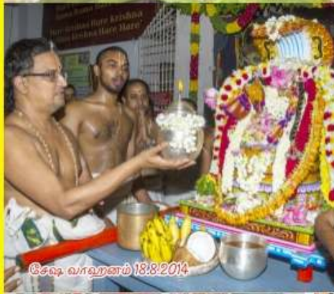
சேஷ வாக்ஷரணம் 18.8.2014