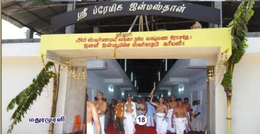
ஸ்ரீ ப்ரேமிக ஜன்மஸ்தான்

அபி ஸ்வர்ணமய லங்கா நமே லக்ஷ்மண ரோசதே! ஜனனி ஜன்மபூமிஸ் ஸ்வர்காதயி கரியஸி||