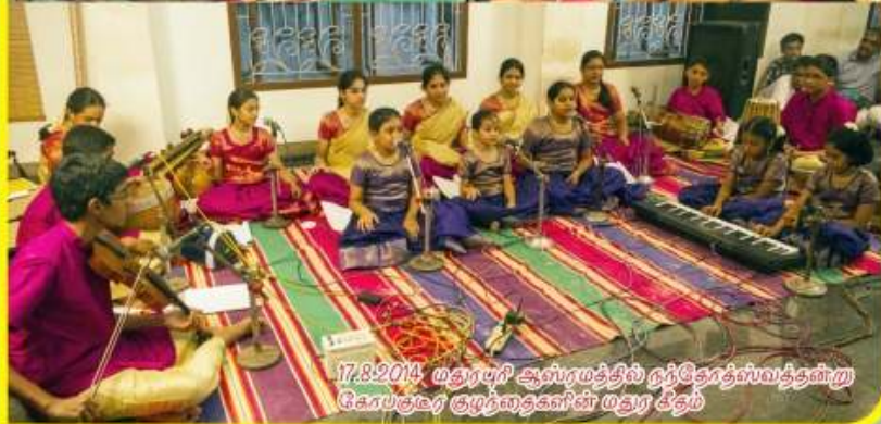
17.8.2014 மதராஸ் ஆன்டரயத்தில் நக்சேர்தல்வத்தன்று கோயத்திர குழுவதானின் மதரா கீதம்