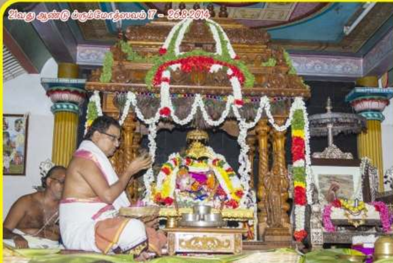
21வது ஆண்டு பருமீமோத்ஸவம் 17 - 26.8.2014