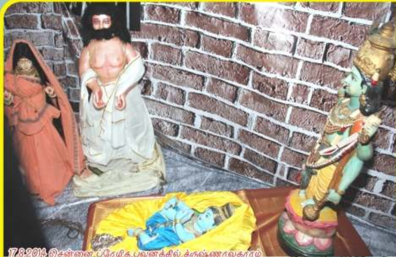
17.8.2014 சின்னை ப்ரேமிக பவனத்தில் க்ரஹணாவதாரம்