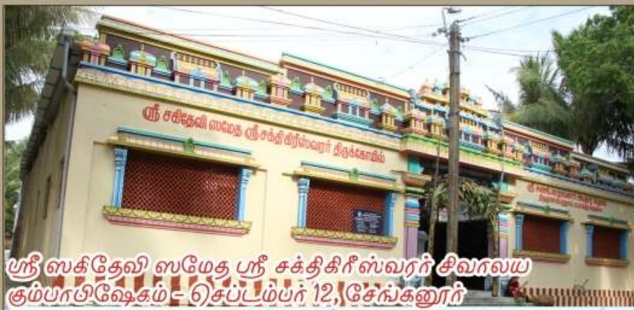
ஸ்ரீ ஸக்தேவி ஸமேத ஸ்ரீ சக்திகிரீஸ்வரர் சிவரவய கும்பாபிஷேகம் - செப்டம்பர் 12, சேங்கனூர்