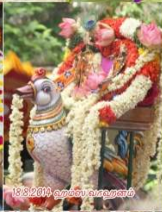
18.8.2014 வரமஸ வரவரணம்